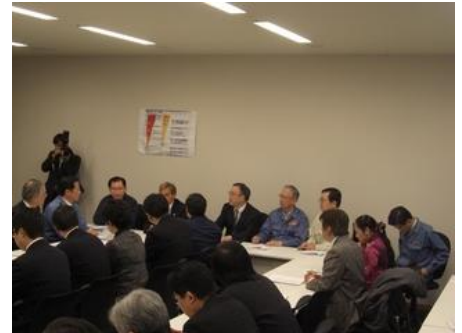
*公明党福島第一原子力発電所災害対策本部