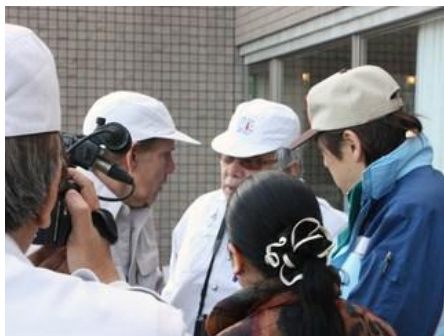
*福島視察 1 (Jビレッジを訪問)