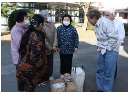
*福島視察 2 (避難所(四倉高校)を訪問)