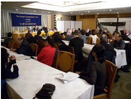
*外国人記者クラブでの会見