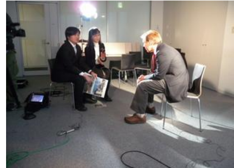
*サンデーフロントライン(テレビ朝日)の取材