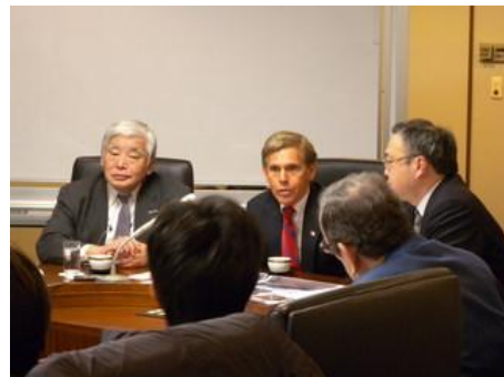
*福島視察後に開かれた記者会見