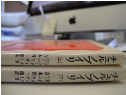
*チェルノブイリ～アメリカ人医師の体験～